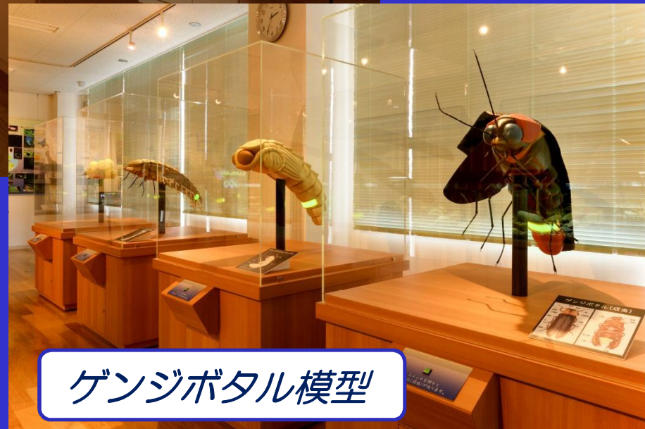
ゲンジボタル模型